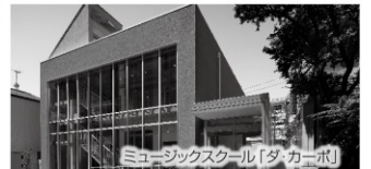
ミュージックスクール「ダ・カーポ」