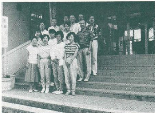
西部公民館前にて