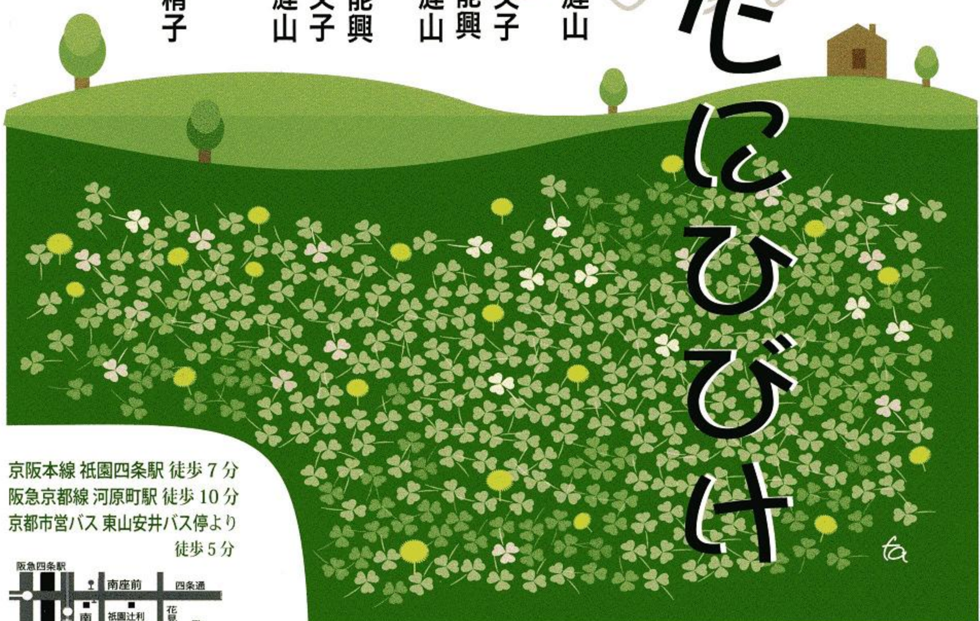
四葉のクローバーはひとつだけ。しあわせをGetするひとはだれ?