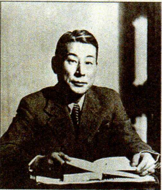
הקונסול סוגיהארה. הציל אלמים

ואיך קרה שהחליטו לנגן את היצירה מחדש? "מיכאל וולפה, המנהל המוזיקלי של 'חג המר'