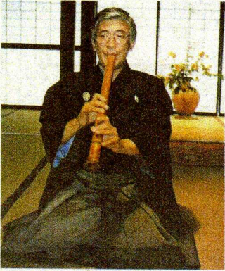
הסולן קוראהשי וחליל השקוהאצי. צילולו דומה לשופר